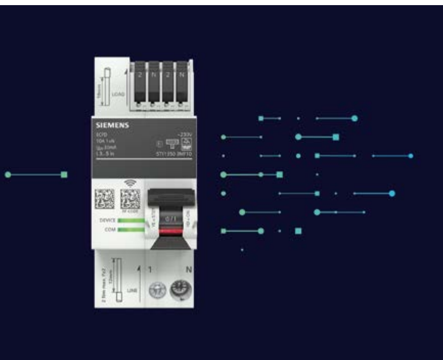
SENTRON ECPD (Electronic Circuit Protection Device - elektronisches Schutzschaltgerät)

ermöglicht Massnahmen zur Optimierung von Anlagen und Prozessen und senkt so Energie- und Betriebskosten effizient. Erstmals ist auch eine detaillierte Zustandsüberwachung der Applikationen auf Endstromkreis-Ebene möglich. Die Vielzahl von Messdaten ermöglicht die Erkennung von Unregelmässigkeiten und Abweichungen und schafft eine sichere Planungsbasis für vorbeugende Instandhaltung. Das SENTRON ECPD lässt sich hierbei in überlagerte Systeme durch Verwendung des offenen Modbus TCP-Standards spielend integrieren. Darüber hinaus sind Fern Diagnosen und ein Fernschalten im Normalbetrieb, aber auch im Fehlerfall möglich. Das SENTRON ECPD vereint zahlreiche Produktfunktionen in einem Gerät. Je nach Applikation sind so Einsparungen von bis zu 80 Prozent Elektronik, 90 Prozent Metall, und 90 Prozent Kunststoff möglich. Insgesamt spart es rund 90 Prozent an Gewicht ein im Vergleich zu den sonst notwendigen Geräten. Im Gegensatz zu Lösungen mit heutiger konventioneller Technik benötigt das SENTRON ECPD ausserdem bis zu 80 Prozent weniger Platz im Verteilersystem, was kostspielige bauliche Massnahmen überflüssig macht.